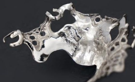
製作：有限会社カナイナビデント 金井孝行氏