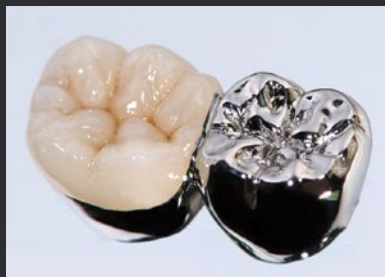
製作：ODA 小倉 眞氏