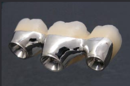
製作：フェスタデンタルテクノロジー 山口 芳正氏