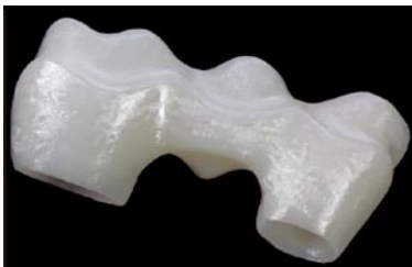
ジルコポルによる研磨前