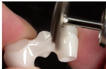
ジルコポルと研磨用ブラシをもちいることでよりスピーディーに研磨できます。